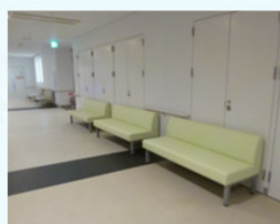
附属病院の待合椅子増設